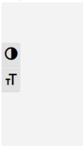
Μηχανισμοί εναλλαγής μεγέθους γραμμάτων και υψηλής αντίθεσης

Κατά την επίσκεψη του χρήστη στην πλατφόρμα Διαβούλευσης και ειδικότερα στα αριστερά της αρχικής σελίδας, παρατηρείται ότι υπάρχει το κουμπί “τΤ”, το οποίο μπορεί να επιλέξει ο χρήστης για να μεγαλώσει ή να μικρύνει τη γραμματοσειρά των γραμμάτων στην πλατφόρμα.